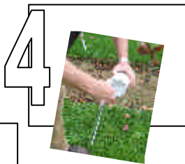
MISE EN PLACE