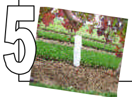
MISE EN PLACE SUR LE PLANT