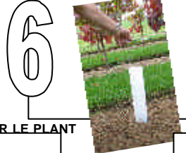
MISE EN PLACE SUR LE PLANT